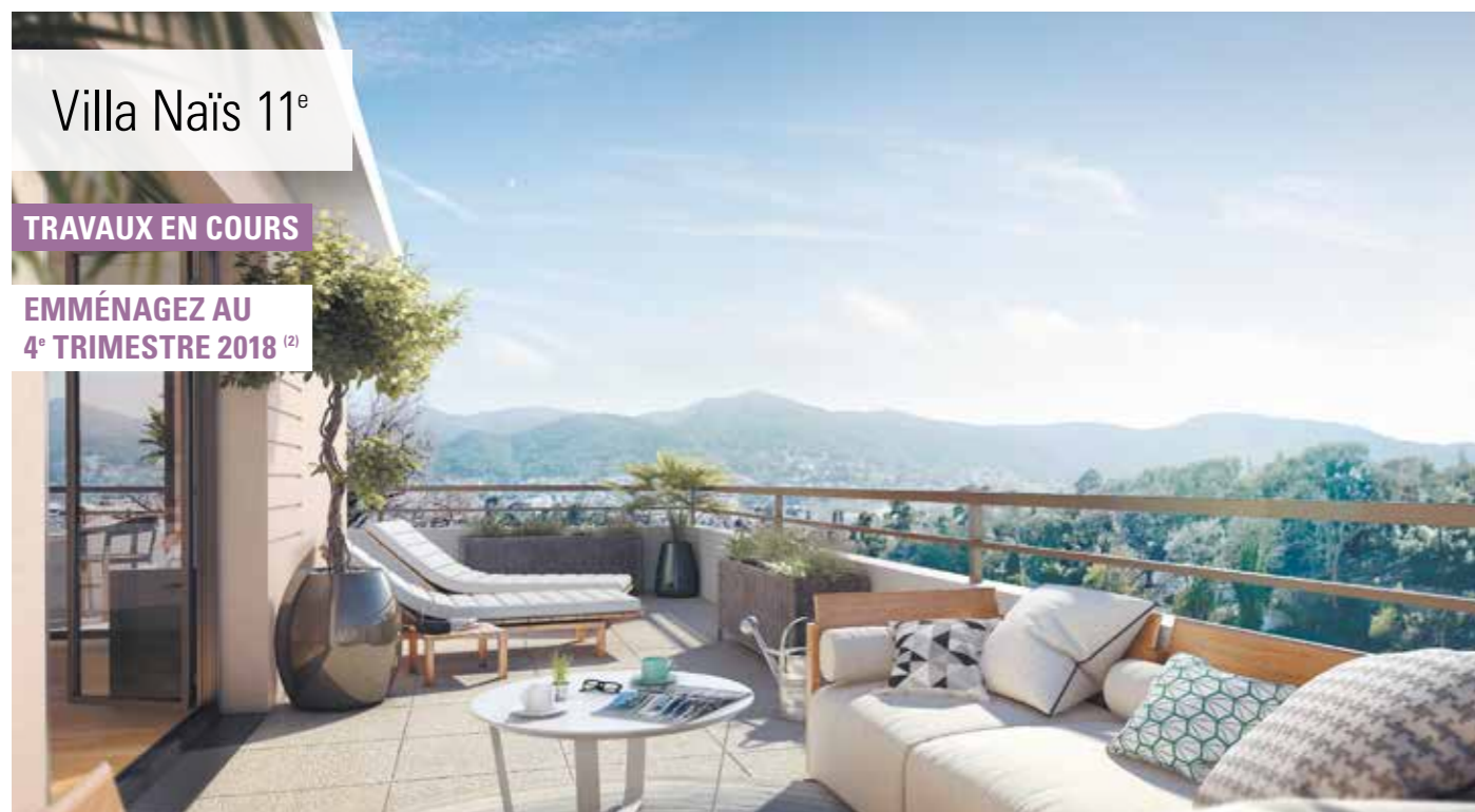
Villa Naïs 11 e