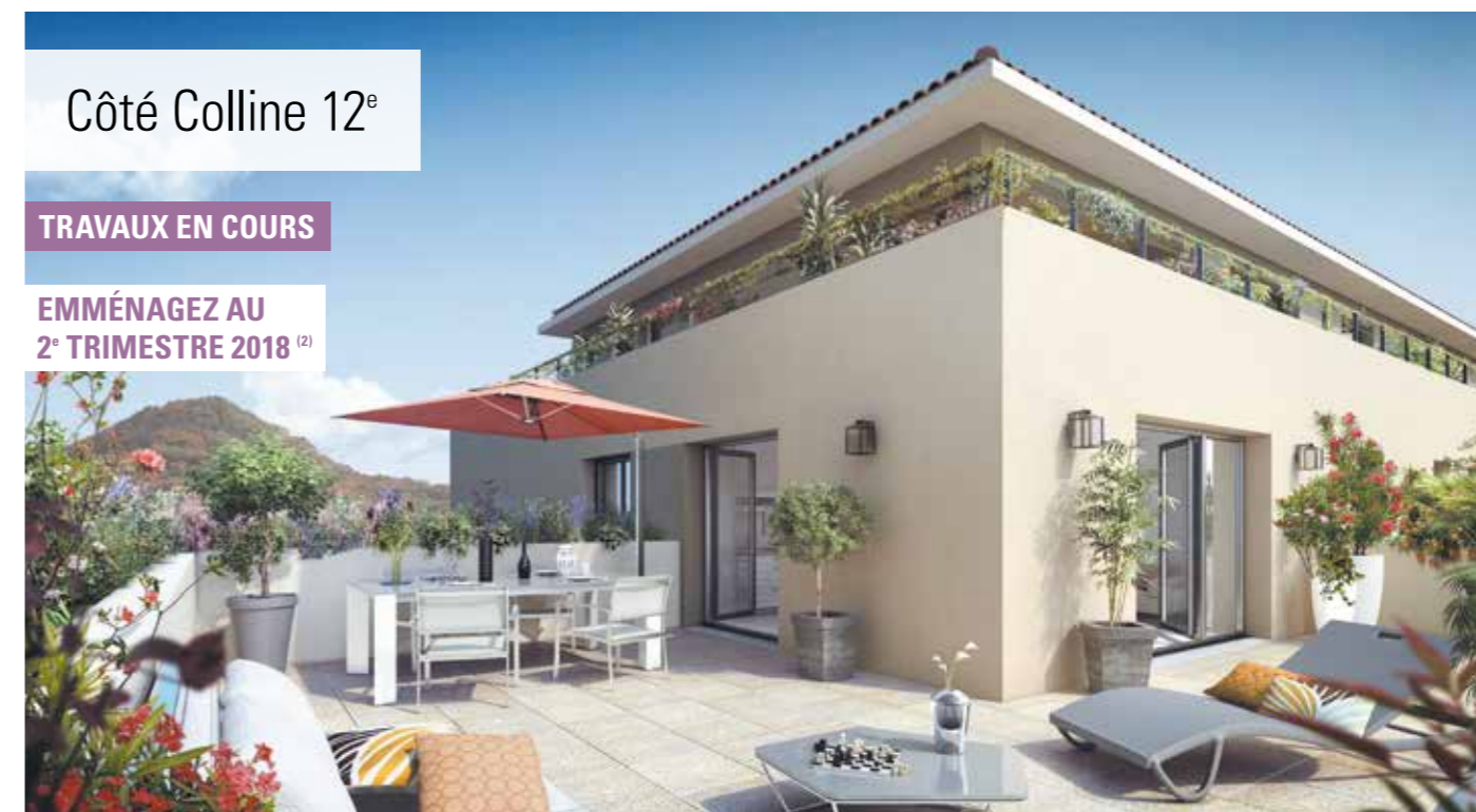
Côté Colline 12 e